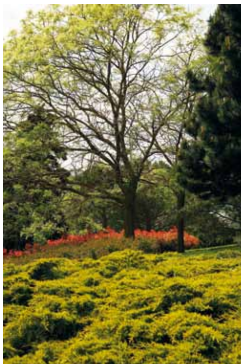
Le Parc Montjuzet, ouvert tous les jours, de 7 h 30 à 21 h.