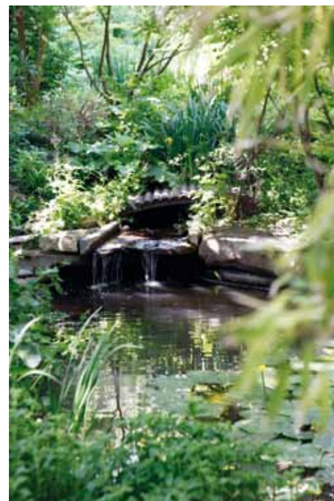
Le Jardin botanique, ouvert tous les jours, du lundi au vendredi, de 8 à 17 h. Visites guidées sur rendez-vous : tél. 04 73 42 68 45, 10, rue de La Charme.