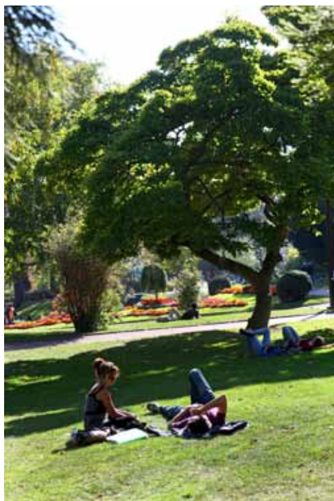
À côté des expositions de dahlias déclinées dans les jardins et les parcs, le Jardin Lecoq offre aux flâneurs toute une palette d'activités : tours de manèges, jeux pour les enfants, plan d'eau et cygnes, tous les jours, de 6 h 45 à 21 h, entrée angles boulevard François-Mitterrand, avenue Vercingétorix et Cours Sablon.