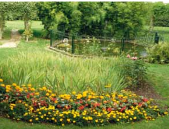
Le Jardin du muséum Henri-Lecoq, 15, rue Bardoux, tél. 04 73 42 32 00. Ouvert tous les jours, sauf dimanche matin, lundi et jours fériés, de 10 à 12 h et de 14 à 18 h.

En savoir plus : tél. 04 73 42 32 00 Visite libre uniquement. Sur réservation pour les groupes au 04 73 42 32 02 ou 07. Ouvert l'été, du mardi au samedi, de 10 à 12 h et de 14 à 18 h ; le dimanche de 14 à 18 h. Contact : muséum Henri-Lecoq, 15, rue Bardoux, tél. 04 73 42 32 00, e-mail : musee.lecoq@ville-clermont-ferrand.fr En savoir plus sur le site de la Ville de Clermont-Ferrand : www.clermont-ferrand.fr/Musees