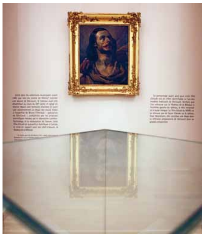
Gerfaut (dit aussi Gerfaut), ancien soldat des armées impériales, servit de modèle pour le naufragé mort situé à l'extrême gauche du radeau.