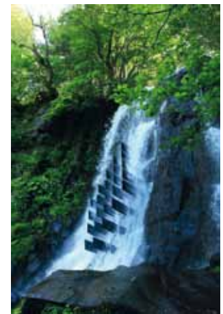
Labo Horizon : une prouesse technique et une œuvre mystique de Laurent Gongora sur la cascade d'Anglard.

Tarifs : 5 € - 3 € - gratuit : étudiants, journalistes, enseignants, titulaires du RSA, - de 19 ans, détenteurs de la carte Citéjeune, demandeurs d'emploi, employés de la Ville et de l'Office de tourisme, personnes en situation de handicap accompagnées. Gratuit pour tous les dimanches 1 er juillet, 5 août et 2 septembre.